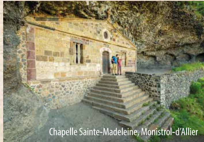
Chapelle Sainte-Madeleine, Monistrol-d'Allier

Organisez votre séjour sur cheminsdesaint-jacques.com